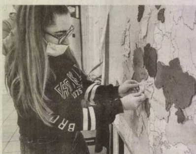
Számos európai országot meglátogattak már a tanulók

Az intézmény igazgatója hozzátette: a Nógrád Megyei Szakképzési Centrum támogatásával szervezett program idén némi hiánypótlásnak is tekinthető. Az iskola diákjai, illetve kollégái ugyanis jártak már szakmai tapasztalatszer-