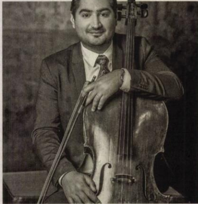
A művész a városban alapozta meg tanulmányait. Beküldött fotó