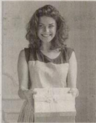
Dobozban várják az ajándékokat