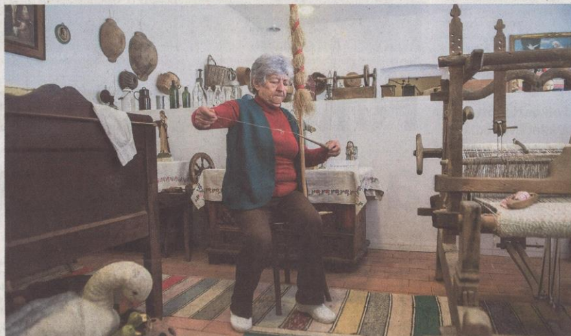
Szurdokpüspökön több fejlesztéssel is erősíteni kívánják a térség idegenforgalmi fellendülését