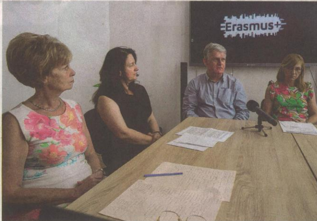
Az idei külföldi gyakorlatokra is sikeres pályázatot nyújtottak be az intézmények

Az Erasmus+ programra külön pályázat két intézmény im-