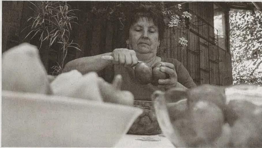
Sorra készítik a háziasszonyok a magyarok egyik legnépszerűbb ételét, a lecsót, amelyet téle is eltesznek