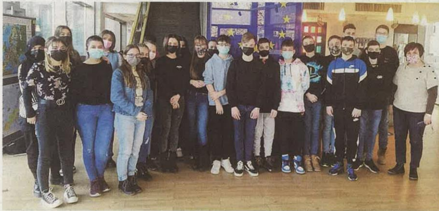
A salgótarjáni Gagarin Általános Iskola diákjai hasznosnak s ugyanakkor érdekesnek is találták a közös kirándulást

Az infópont munkatársai többéves szakmai tapasztalattal rendelkeznek, ezen tudásukat tartották interaktív EU-tanórákat. A látogatások előre összeállított, valamint az iskola által választható, az osztályok igényeinek megfelelően testreszabható programelemekből épülnek fel. A program célja, hogy a szer-