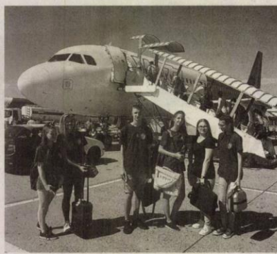
Unió országokban szerezhetnek tapasztalatot a diákok.

- Azonos esélyt biztosítunk minden diákunknak, hiszen gondoskodni kívánunk a gyermekek jelenének és jövőjének biztonságáról. Büszkén mondhatom, hogy olyan iskola vagyunk - és leszünk -, ahová a tanár és a diák egyaránt szívesen jár. Azt szeretnénk elérni, hogy a világ történéseire fogékony, a szakmájában jól felkészült, idegen nyelven folyékonyan kommunikál-