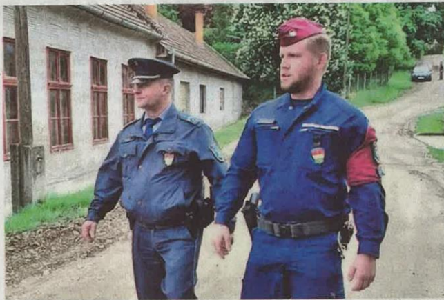
Járőröznek Vanyarcon. A rendőri jelenlét eredményei máris megmutatkoztak